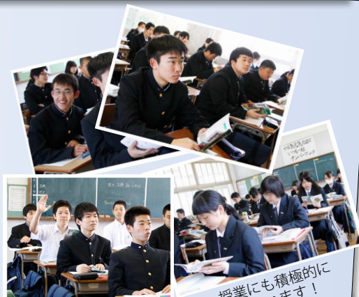
授業にも積極的に 臨んでいます！

4月29日～5月1日の3日間、本校の新一年生は「自立と協働を学ぶ宿泊体験学習」(英彦山青年の家)に参加し、元気に研修を行いました。体験学習後は高校生活にも慣れ、真剣な表情で授業を受けています。現在は「嶽南祭」(本校文化祭)6月5日(金)、6日(土)に向けて合唱練習や展示制作に頑張っているところです。