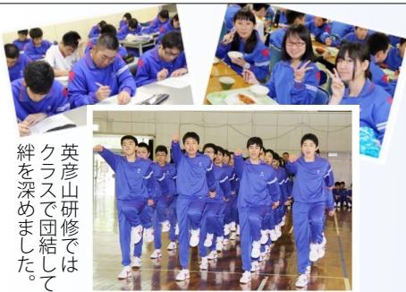
英彦山研修では クラスで団結して 絆を深めました。

4月29日～5月1日の3日間、本校の新一年生は「自立と協働を学ぶ宿泊体験学習」(英彦山青年の家)に参加し、元気に研修を行いました。体験学習後は高校生活にも慣れ、真剣な表情で授業を受けています。現在は「嶽南祭」(本校文化祭)6月5日(金)、6日(土)に向けて合唱練習や展示制作に頑張っているところです。